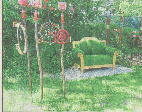
Ein Platz zum Erholen.