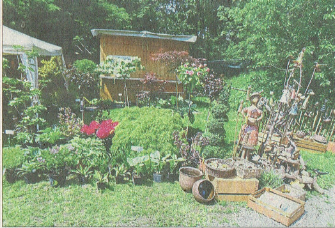
Blumen und Gartendeko beherrschten die Ausstellung.