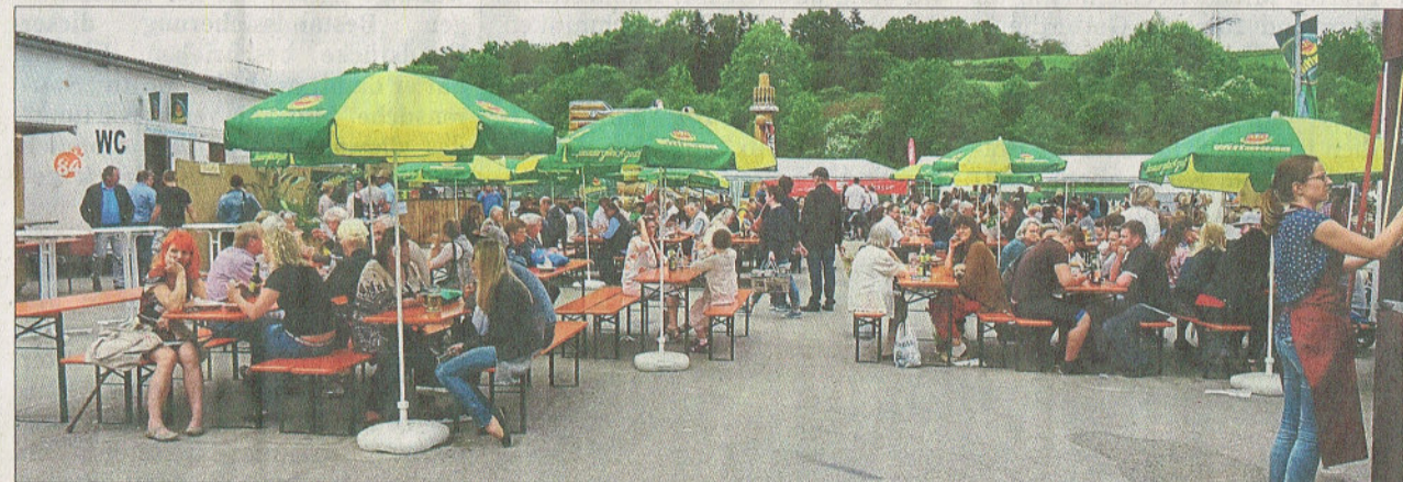
Nach dem Rundgang lockte der Biergarten im Ausstellungsgelände zum Ausruhen.

guten Ruf des Ortes beiträgt. Einig waren sich aber auch alle, dass man nur hoffen könne, dass es auch im nächsten Jahr wieder einen „Aldorfer Gartenzauber“ geben wird und das Ehepaar Hübner nochmals diesen enormen Arbeitsaufwand schultern kann.