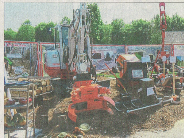
Der Maschinenpark faszinierte Profis und Hobbygärtner.