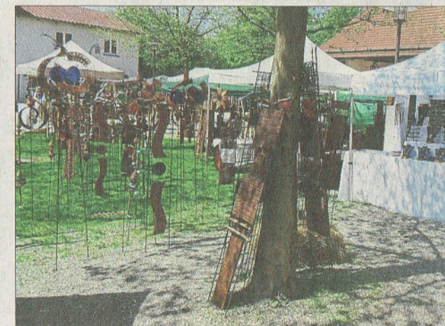
Zur Zierde gab es unterschiedlichste Dekorationsartikel.