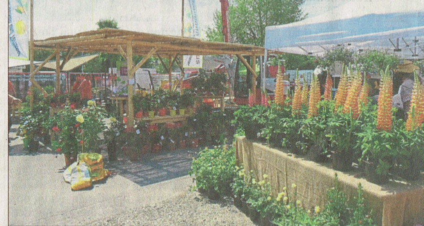
Das Blütenmeer an den verschiedenen Ständen war eine Pracht.